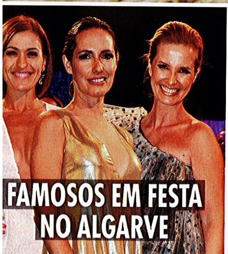
FAMOSOS EM FESTA NO ALGARVE