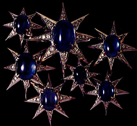
Fulco di Verdura