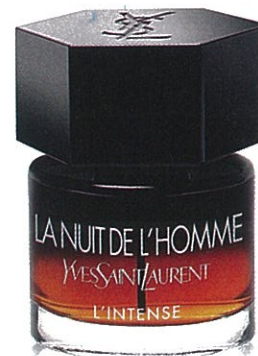
Yves Saint Laurent, La Nuit De L'Homme Intense (60 ml) – preço sob consulta