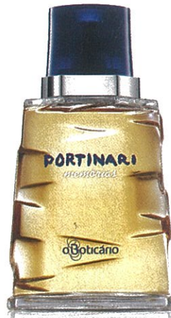
Boticário, Portinari Memórias (EDT 100 ml) – € 29,99