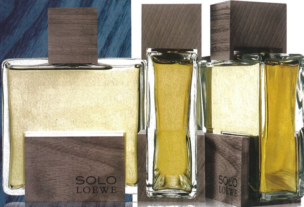
Loewe, Solo Loewe Cedro: 50 ml – € 75,40; 100 ml – € 103,30