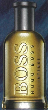
Boss, Bottled Intense (50 ml e 100 ml) – preço sob consulta