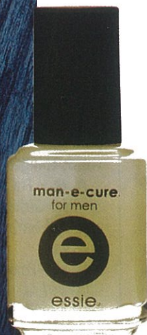
Essie, Manecure (15 ml) – € 15,90