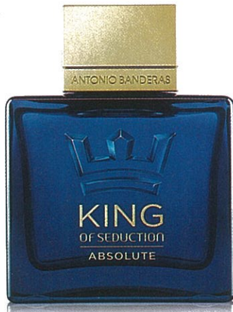
Antônio Banderas, King of Seduction Absolute – preço sob consulta