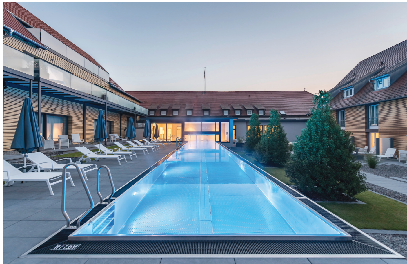
Hotel Schloss Reinach ..... Foto de www.medilor.de

As piscinas em inox, pela sobriedade, elegância e boa integração que apresentam, em ambiente interior ou exterior, são uma tendência europeia há já alguns anos e mais recentemente uma inovação em Portugal.