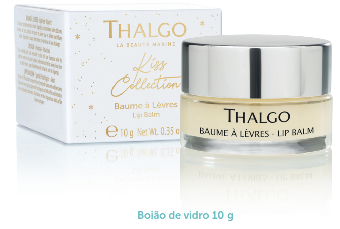
Boião de vidro 10 g

Aplicar diretamente nos lábios com a polpa dos dedos. Renove tão frequentemente quanto necessário durante o dia. À noite pode aplicar em camada espessa, para atuar como uma máscara.