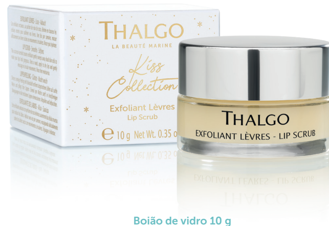
Boião de vidro 10 g

Massaje suavemente com movimentos circulares, diretamente nos lábios não humidificados. Enxague os lábios macios uma vez, alise e depois hidrate-os com um bálsamo protetor labial.