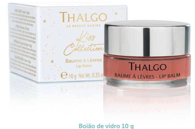
Boião de vidro 10 g

Aplicar diretamente nos lábios com a polpa dos dedos. Renovar tão frequentemente quanto necessário durante o dia.