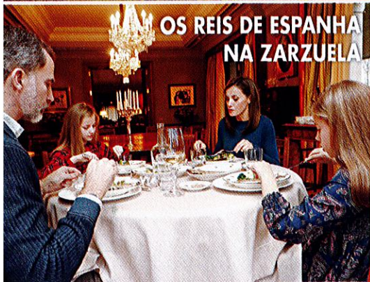
OS REIS DE ESPANHA NA ZARZUELA