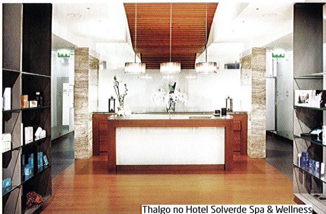
Thalgo no Hotel Solverde Spa & Wellness