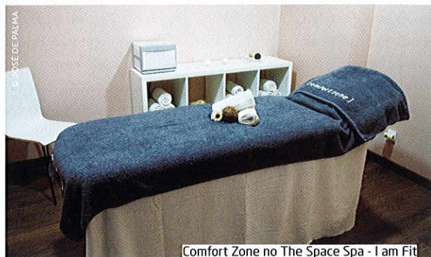
Comfort Zone no The Space Spa - I am Fit