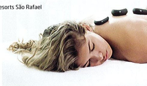
Comfort Zone no NAU Hotels & Resorts São Rafael